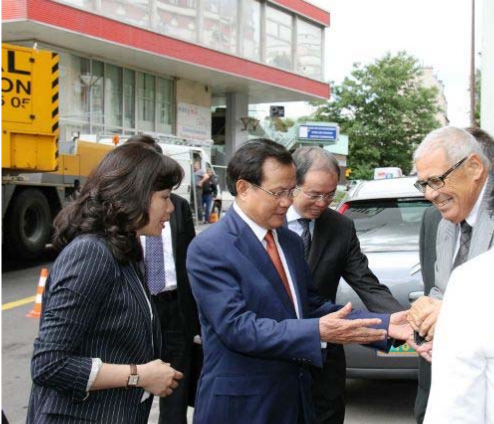
Đoàn gặp lãnh đạo ĐCS Pháp.

Lãnh đạo ĐCS Pháp cho rằng thành công của Đảng ta chính là trong công cuộc đổi mới đã bảo đảm sự đồng thuận về mặt chính trị, đồng thời đáp ứng được những thách thức do tình hình mới đặt ra trên tất cả các lĩnh vực kinh tế, chính trị, xã hội và mong rằng ĐCSVN xây dựng thành công chủ nghĩa xã hội.