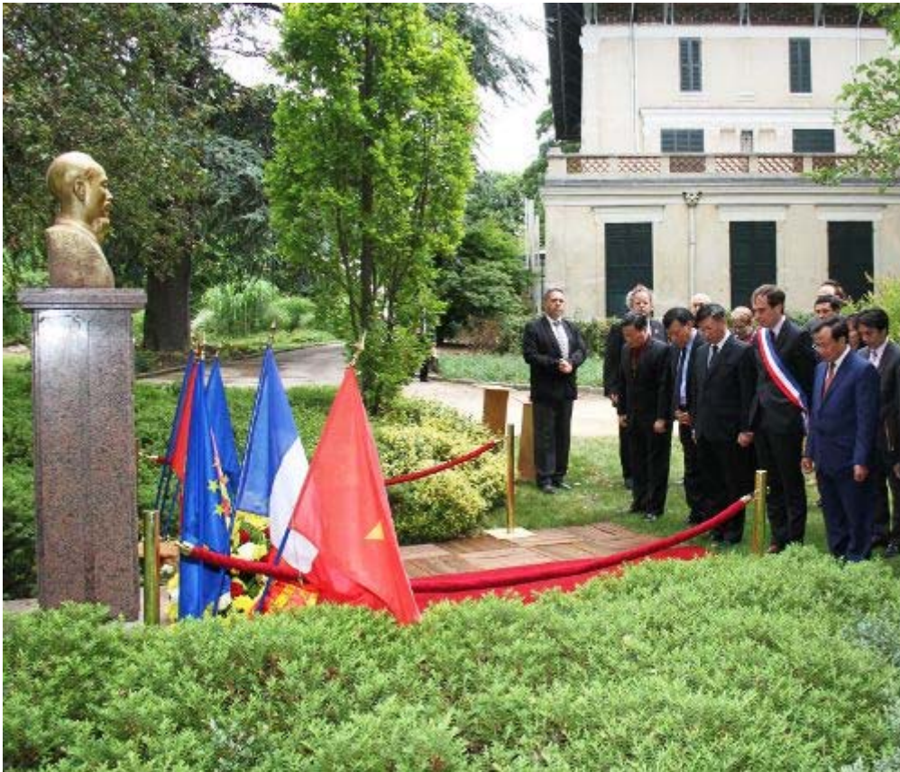
Đoàn đặt lẵng hoa tại Tượng đài Chủ tịch Hồ Chí Minh ở TP Montreuil.

Tiếp đó, Đoàn đã gặp gỡ, trao đổi với các lãnh đạo Đảng Cộng sản Pháp. Thay mặt đoàn đại biểu Đảng Cộng sản Việt Nam, đồng chí Phạm Quang Nghị thông báo với bạn một số nét chính về tình hình kinh tế-chính trị của Việt Nam, quan hệ đối ngoại, công tác chuẩn bị Đại hội lần thứ XII của Đảng; trao đổi về tình hình quốc tế, khu vực và chuyển lời thăm hỏi của các lãnh đạo Đảng, Nhà nước tới các lãnh đạo, cán bộ, đảng viên Đảng Cộng sản Pháp.