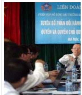
Luật sư VN tiếp tục đề n