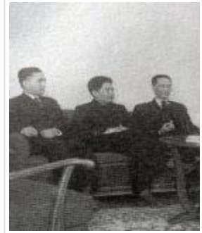
Hội nghị Genève: 5 bài học hôm nay

Cũng trong ngày 23-6, Đoàn tới đặt vòng hoa tại Tượng đài Chủ tịch Hồ Chí Minh, thăm Không gian Hồ Chí Minh trong công viên Montreau ở TP Montreuil. Bí thư Thành ủy Hà Nội Phạm Quang Nghị cảm ơn chính quyền TP Montreuil đã dành sự quan tâm đặc biệt tới những kỷ vật gắn với thời gian hoạt động cách mạng của Bác Hồ ở Pháp và coi đó như một phần di sản văn hóa quan trọng của thành phố.