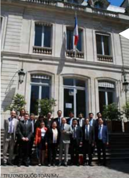
TRƯƠNG QUỐC TOÀN/IMV