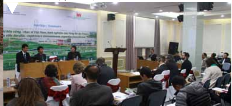
LÊ HOÀNG VIỆT/IMV

Hội thảo do HUPI và IMV tổ chức với các doanh nghiệp và công ty tư vấn quy hoạch của Vùng Île-de-France : Concepto, Urbanica, Interscene, DeSo, Cerway, Signes paysage, Jakob + Macfarlane ; cùng với Viện Quy hoạch Đô thị và Nông thôn Quốc gia Việt Nam (VIUP), Trường Đại học Kiến trúc Hà Nội, các sở ban ngành về phát triển đô thị của Thành phố Hà Nội và nhiều nhà đầu tư bất động sản của Việt Nam và quốc tế.