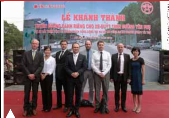
LÊ HOÀNG VIỆT/IMV